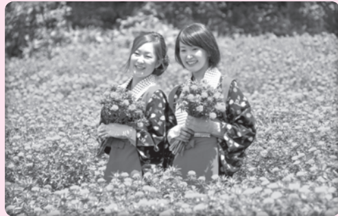
桜まつりでの人間将棋やくちびる美人コンテスト、天童紅花まつりなど特色のある様々なイベントも盛んです。

特色 山形県の東側に位置する天童市は、将棋の駒の生産量が日本一の市として知られています。果物の生産も盛んで、果物の女王ラ・フランスの生産量も日本一です。最近は、こうした特産品をプレゼントするふるさと納税にも注目が集まっています。