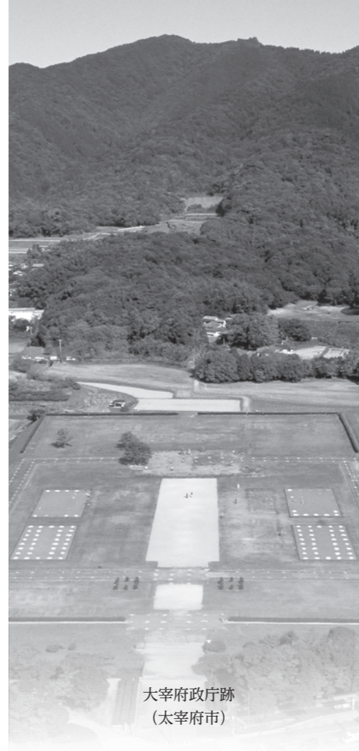
大宰府政庁跡 (太宰府市)

奈良時代、時の朝廷は多賀城に、朝廷の出先機関として陸奥国府多賀城を設置しました。都である奈良平城京を中心に、西には大宰府が置かれ、東には多賀城。この3都市があつて古代国家が形づくられていたと言っても過言ではなく、ともに国を守るために緊密に結ばれていました。この3都市の結びつきをより強くするため、奈良市において「平城遷都1300年」を迎えた平成22年に友好都市の関係を結びました。