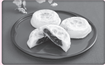
天満宮参道で食べられる餡入りの焼餅「梅ヶ枝餅」。毎月25日はヨモギ入りが食べられます。

特色 福岡県の中部に位置する太宰府市は、北に四天王山、東に宝満山、市街地を流れる御笠川があり、近年の住宅化や大学の立地などにより人口が急増した住宅文教都市です。また、太宰府天満宮をはじめとする数多くの史跡や名所にあふれ、年間760万人もの観光客が訪れています。