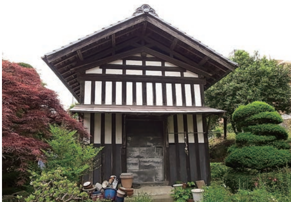
市内で最大規模の板倉(伝上山地区)

このような板倉は、建設年代が海軍工廠建設以前にさかのぼると考えられることから、70年以上の歴史を持つ歴史的建造物といえます。さらに、本市における太平洋戦争の一コマを物語る歴史資料としても貴重なものです。