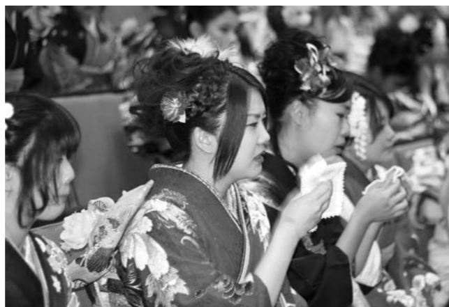
恩師の懐かしい姿に涙も