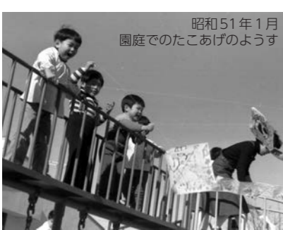
昭和51年1月 園庭でのたこあげのようす