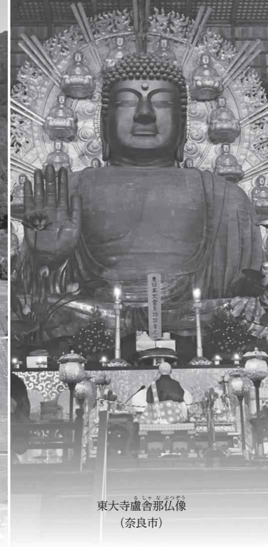
東大寺盧舎那仏像 (奈良市)