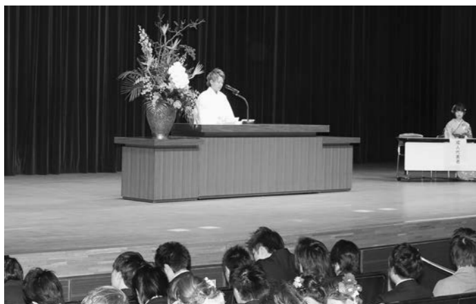
新成人代表のあいさつ

式典では、成人代表のあいさつや中学校時代の恩師のスピーチが行われ、感激のあまり涙を流し聞き入っている方もいました。