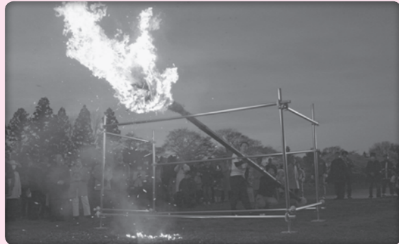
「お松明」「お水とり」ともいわれる東大寺二月堂の修二会。752年から一度も途絶えることなく続いています。平成25年4月16日、門外不出の籠松明が本市に贈られ、鎮魂と復興への祈りを込めて火が灯されました。

特色 奈良県の最北部に位置する奈良市は、多くの歴史的文化遺産が存在する、日本を代表する観光都市です。1998年には、「古都奈良の文化財」として東大寺や春日大社などが世界遺産に登録されています。