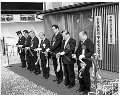
開所式テープカットの様子

新しい警察官立寄所では、警察官立寄りのほか、多賀城駅周辺の安全安心ステーションや、防犯・交通関係団体などの活動拠点として、より一層、地域の安全安心を見守っていきます。