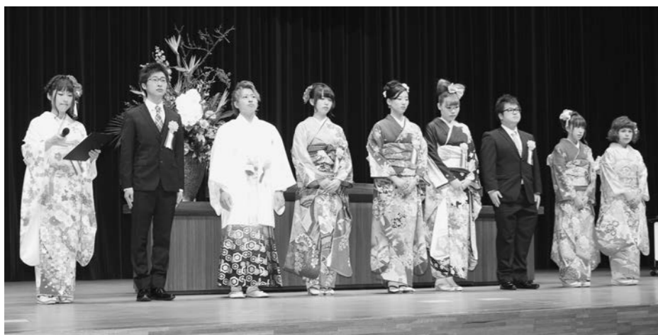
成人式実行委員の皆さん

サイバーテロに備えた研究、EV(電気自動車)バス乗車体験、世界最大のLED照明によるレタス栽培工場やブルーレイディスクの生産現場を見学しました。参加した児童らは、目を輝かせ、身を乗り出すように説明に聞き入っていました。