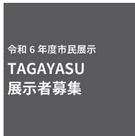
令和6年度市民展示 TAGAYASU 展示者募集