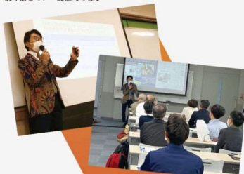
前年度セミナー開催時の様子

2003年渡米、NYの大学へ進学し2011年帰国。 東日本大震災で開局した宮城県山元町の臨時災害FM「りんごラジオ」アナウンサー兼ディレクターを開局当初から務める。現在までに、「Rakuten.FM TOHOKU」「FMなとり」「tbc東北放送」、スポーツイベントMC、宮城県内の催事や典司会などを多数担当。エネルギッシュでハツラツとした司会、英語を活かしたMCスタイルで活躍中。各種ワイド番組の担当、特別番組・取材・レポートなど幅広く制作。リスナーファースト・地域密着の番組制作が得意分野。