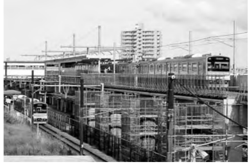
▲着々と工事が進むJR仙石線高架化

また、地域における人と人とのつながりの希薄化等に伴い、子育てに不安を感じる家庭が増加しております。保護者の孤立化を防ぐとともに、子どもを地域全体で育てる仕組みや制度の構築を目指し、子育てサポートセンターの充実等を図ってまいります。