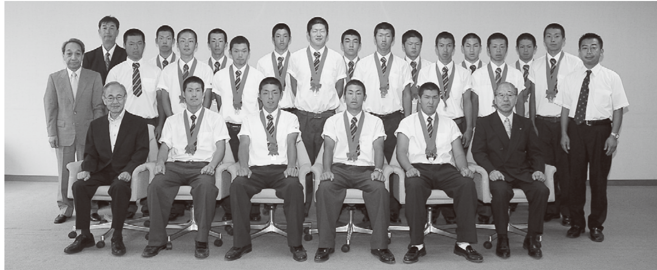
▲全国高等学校野球選手権大会に出場(仙台育英学園高等学校硬式野球部の皆さん)