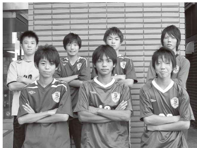
▲塩釜F.C.小・中・高の世代別3チームが各種全国大会に出場(多賀城在住の皆さん(塩釜F.C.所属))