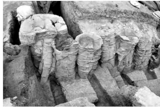
地震で埋没した埴輪列

奈良県天理市にある赤土山古墳で、古墳が造られた当時のままの埴輪列が発見されました。大規模な地震による地滑りが原因で、8mもの範囲にわたって古墳側面が滑落している様子が分かりました。赤土山古墳の周辺は、古代豪族和珥氏の本拠地とされています。和珥氏は応神天皇や雄略天皇など7人の天皇に后妃を輩出した大豪族で、5・6世紀に大和の在地豪族として大きな勢力を誇っていました。