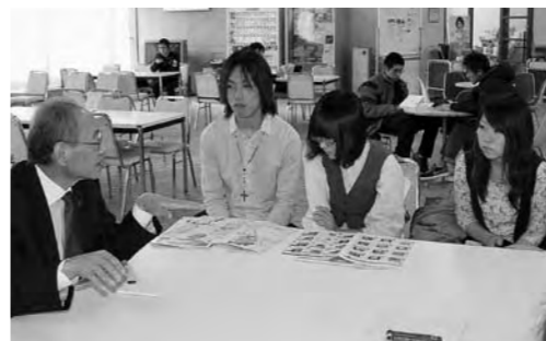
▲市長と話そう 気軽にちよっと茶つと (東北学院大学工学部にて)

この4年間で育まれた市民協働の取り組みをさらに発展、充実させ、地域が抱えるさまざまな課題について、市民の皆さまが自ら考え、みんなで話し合い、そして一緒に解決していくことができる仕組みづくりを行ってまいります。