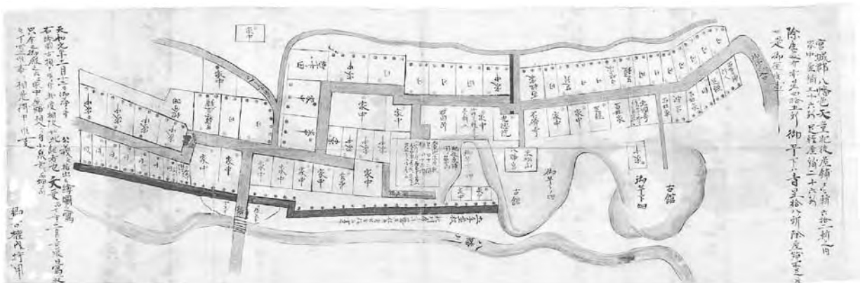
宮城郡八幡邑天童氏屋敷ならびに家中・足軽屋敷絵図 文政7年(1824)写し 市指定文化財

この絵図に描かれたまち並みは、江戸時代以来大きく変化することなくその面影を現在まで伝えており、「末の松山」「沖の井」といった歌枕やまちはずれの供養碑などとともに、八幡の歴史的景観を醸し出しています。