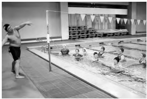
▲水中ウォーキング教室

また、高齢者の方々が住み慣れた地域で誇りを持って生活を送ることができるよう、シルバーワークプラザを拠点として生きがい活動の促進に取り組んでまいります。