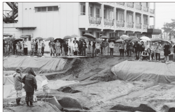
■5月30日、山王遺跡現地説明会に約130人が参加しました。この場所には漆工房があったと思われ、漆が付着した文書には人名と思われる記載が確認されたことなどが紹介されました。