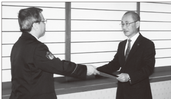
■5月24日に本市は「交通死亡事故ゼロ6カ月」を達成し、宮城県警察本部より祝詞が贈られました。「市民が、地域が、行政が」一体となって積極的に取り組んできた成果であると思います。