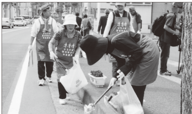
■6月4日、市内のたばこ小売業者約25人が通勤する方々に喫煙のマナーを呼びかけながら、多賀城駅から八幡橋を経由し鎖守橋までの約3キロのコースの清掃活動を行いました。