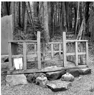
▲実方中将の墓(名取市愛島)

実方を慕ってこの地を訪れた人の中には、歌人として有名な西行、その西行の跡をたどりながら奥の細道を旅した松尾芭蕉などがおり、今なお実方の面影は、多くの人々を引きつけているようです。