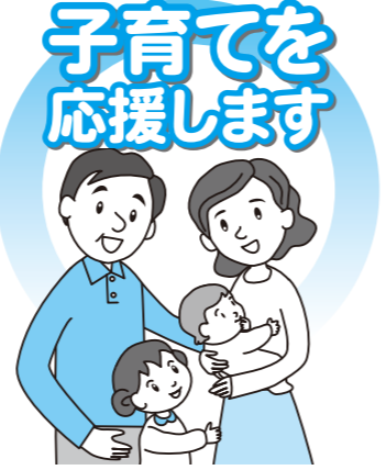
子育てを応援します 「今」だけではなく「未来」へ

●子育ては常に子どもの「未来」を考えて 子育てをするとき、つい目の前の出来事に追われ「今」の子どもの姿に焦点をあてすぎてはいませんか。 子どもはずっと幼いままでではなく、成長し、いずれ大人になります。「上手にできないから」と、子どもがするべきことを親が先取りしてしまうと、子どもの自主性と、達成から生まれる喜びの芽を摘み取ってしまうかもしれません。 子どもが成長したときの姿をイメージしながら、一度立ち止まって考えてみましょう。