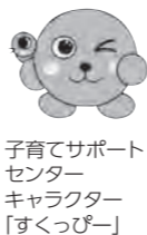
子育てサポートセンターキャラクター「すくすくぴー」