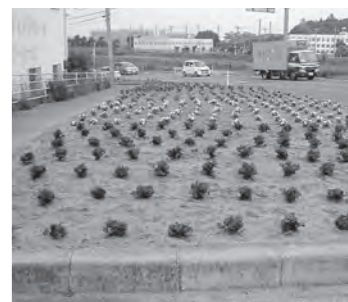
▲『花のまちづくり』の活動例

市内では町内会や学校のPTA、環境美化団体など、さまざまな団体が継続的に『花のまちづくり』を実施しています。沿道の空き地や公園など、それぞれの地域の身近な場所を中心に、マリーゴールド、パンジー、サルビアなどの花々が植えられ、花と緑の環境が生まれています。