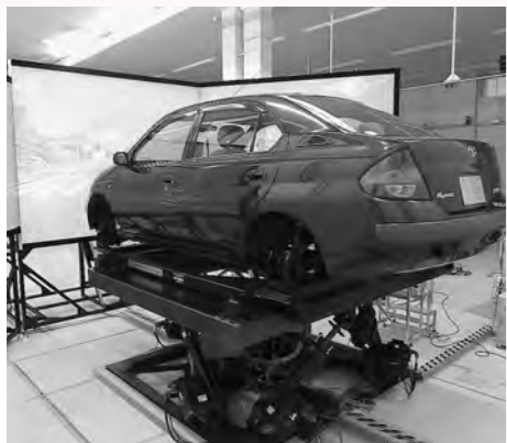
▲実際に走行しているように車体が動くシミュレーター