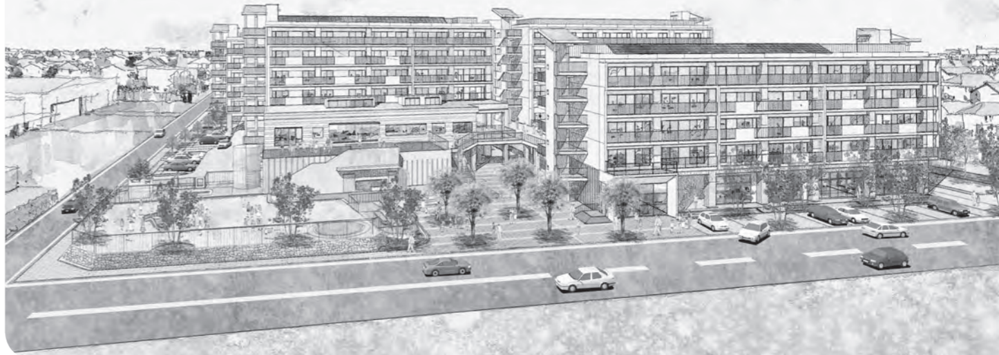
▲桜木地区災害公営住宅完成予想図

施策 「絆」・「つながり」を前提とした健やかな「くらし」の確保と活力ある「こと」の創出