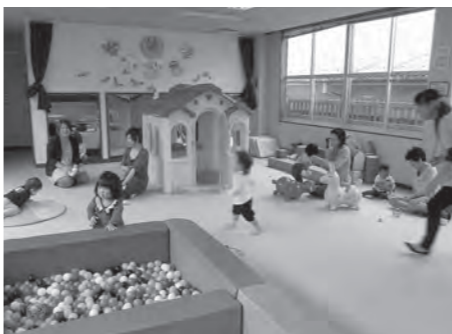
▲プレイルームの様子

さらに、子育てサポートセンター内には「ファミリーサポート事務局」があるので、一時的にお子さんを預かってほしい方は事務局までご相談ください。