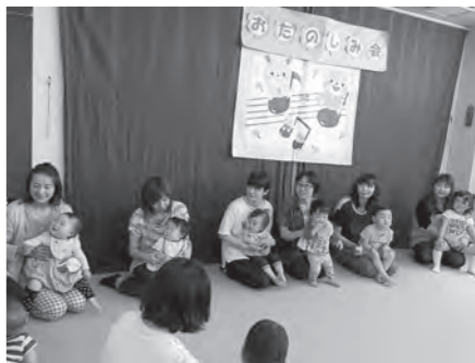
▲おたのしみ会の様子(誕生児の紹介)