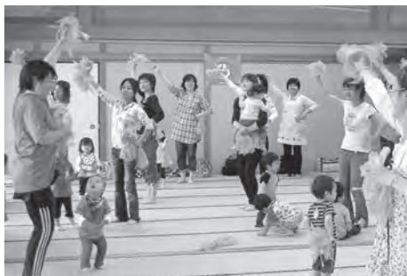
▲キッズデーの様子(親子ピクス)

事業については広報多賀城やホームページ・毎月発行している「すくすくぴーだより」に掲載しています。