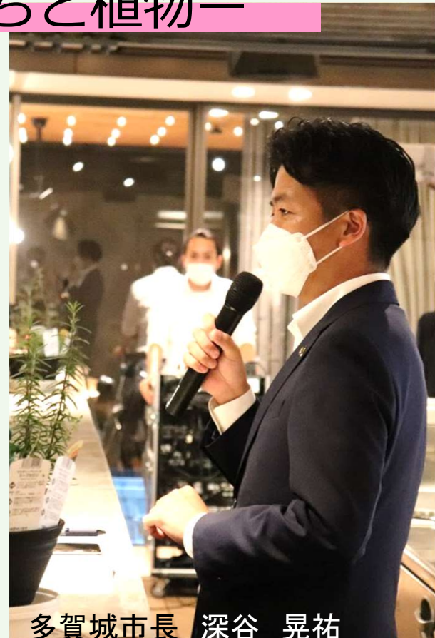
多賀城市長 深谷 晃祐

新型コロナウイルス感染症の影響が未だ収まらない中ではあるけれど、今日は、顔を合わせて、話げできた。最高の気持ちをありがとう。