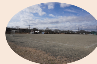
中央公園無料サッカー場