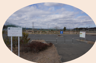
中央公園多目的グラウンド