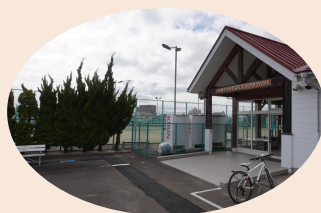
市民テニスコート