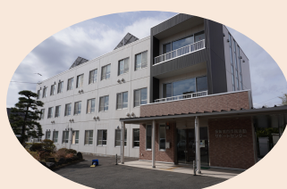
市民活動サポートセンター (空き状況の確認のみ可)