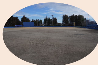
多賀城公園野球場