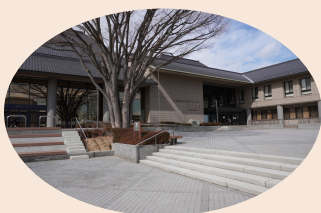
市民会館・中央公民館