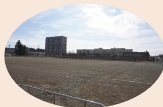
中央公園有料サッカー場