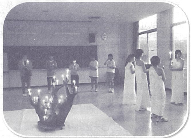
【キャンドルサービス】