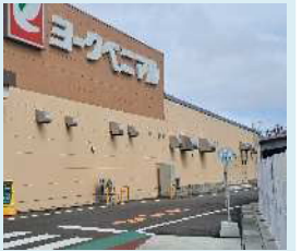
図 商業施設等との連携の一例 (施設への乗り入れ)