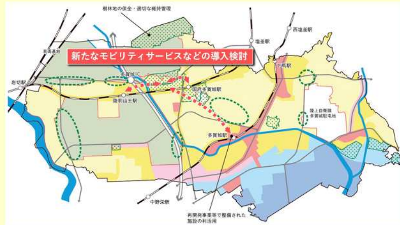
図 新たなモビリティサービスなどの導入イメージ (案)