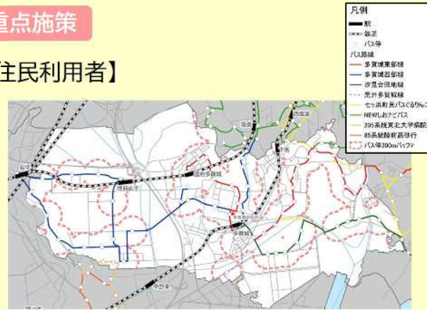
図 路線バスの路線図