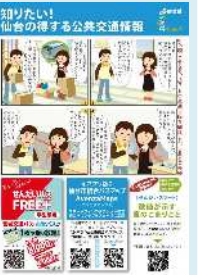
図 仙台市「転入者モビリティマネジメント」の取組