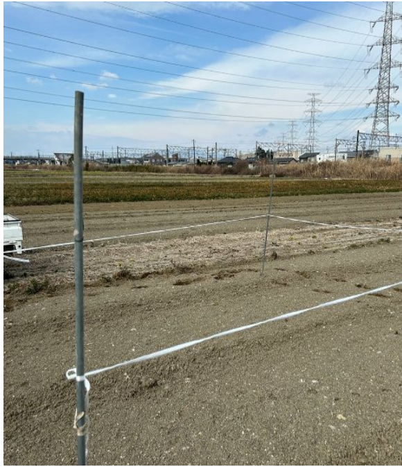
貸しスペースイメージ (5m×6m) 約10坪