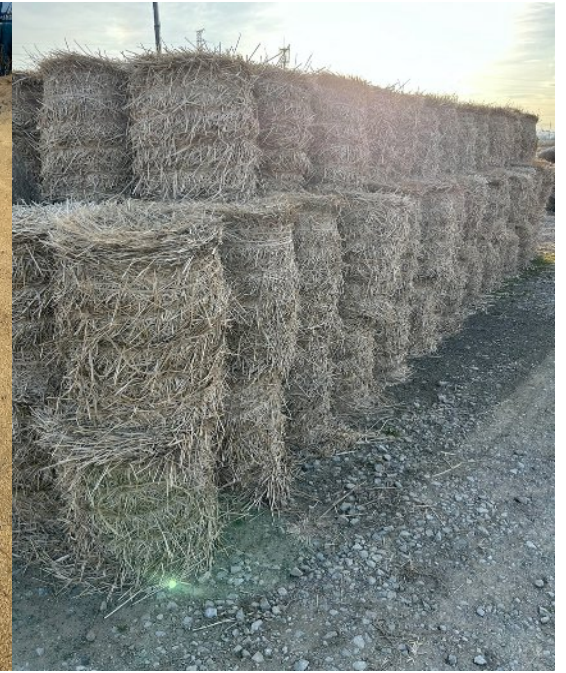
粃殻、藁の有効活用