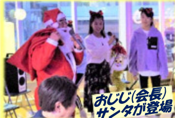
★子供たちが司会進行