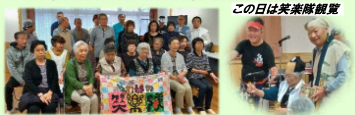
この日は笑楽隊観覧

・あがりん茶屋 毎月第3(水)10:00～宮内住宅集会所 イベント(物作りや運動、観覧など)&お茶会