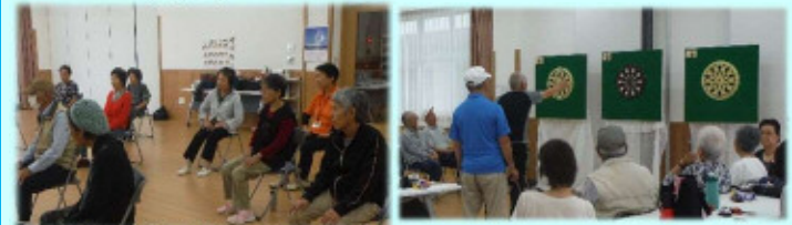
地域たがもり会指導の健康づくり 近隣地域の方も時々参加しています

・たがもり体操会 毎月第2,4(木)10:00～ ・ダーツの会 毎月第3(木)10:00～