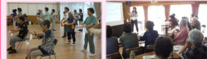
住宅・北区住民一緒に健康づくり 年会費1000円は年度初めに徴収

・スマイル桜木 毎月第2,4(火)10:00～桜木住宅集会所 ・あすなる会 毎週(金)10:00～桜木北区集会所