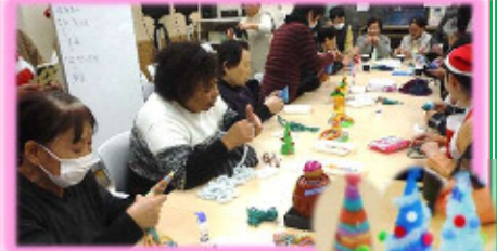
★思い思いの手づくりツリー