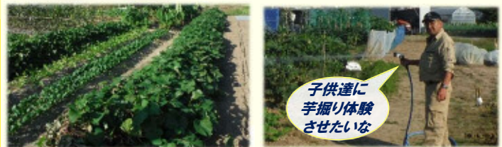
子供達に芋掘り体験させたいな

・共同農園は、住宅とご近所さんの有志11名で作っています。自治会の畑もあり、収穫物は住民のお楽しみに!!