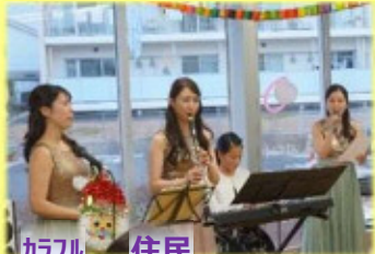
★アラカトと小学生の合同演奏