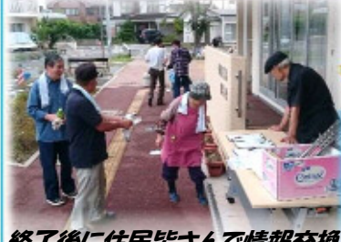
終了後に住民皆さんで情報交換