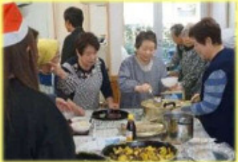
★三区の方も一緒に、豚汁