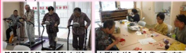
健康器具を使って会話しながら… お話しながら、色々作っています

①健康増進見守りお茶会 ②ものづくりの会 隔週(水)午後 隔週(水)11:00～ 色々な材料で小物づくり