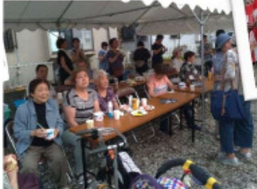
桜木住宅の皆さん

盆踊り・ゲーム・屋台・抽選 など…盛上げ役に大笑い 桜木住宅班はポップコーン を担当