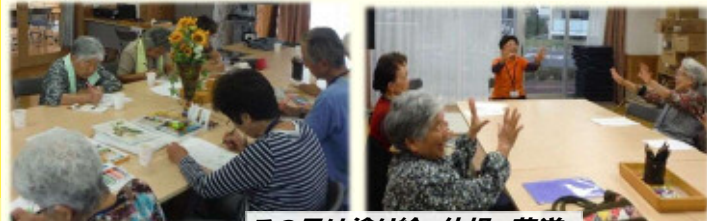
この日は塗り絵、体操、茶道

・大人の絵画サークル 毎月末(金)13:30～新田住宅集会所 塗り絵&何かお楽しみ&お茶会開催