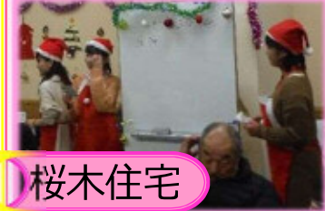
★復興応援団がお手伝い、ビンゴゲーム