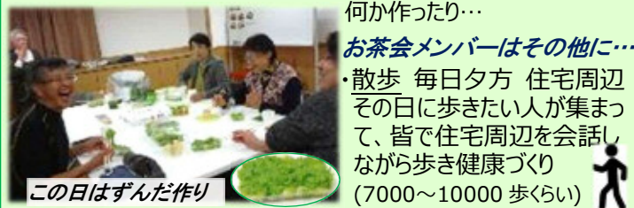
お茶会メンバーはその他に…