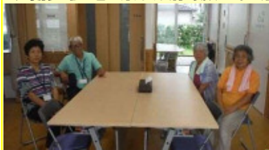
集会所エントランスを談話室に利用 毎週土日 9時から17時に開放