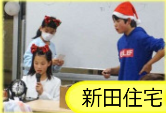
★子供たちによるビンゴゲーム