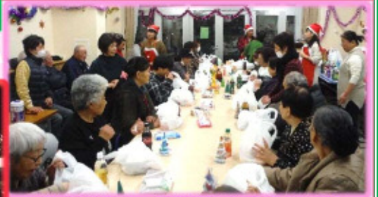
★桜木住宅 2号棟リビング、45名参加