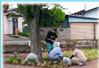
新田三区区長が見回り、情報交換