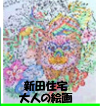
新田住宅 大人の絵画

風は冷たく冬が足早に近づいているこの頃、いかがお過ごしでしょうか？ 寒さ・乾燥対策、うがい・手洗いの強化、適度な運動、予防接種と、インフルエンザの予防は万全ですか？寒い冬もみんな楽しく元気に乗り切りましょう！！