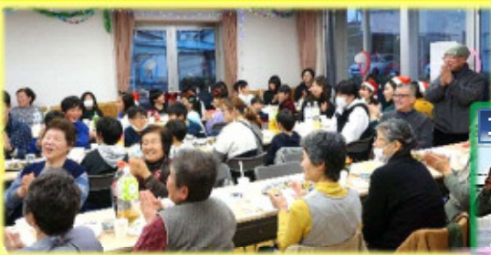
★新田住宅集会所、新田三区の方も多数参加