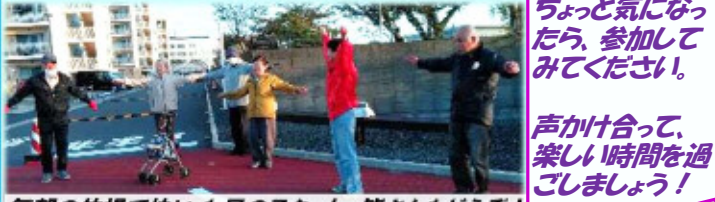
毎朝の体操で快い1日のスタート、皆さんどうぞ!