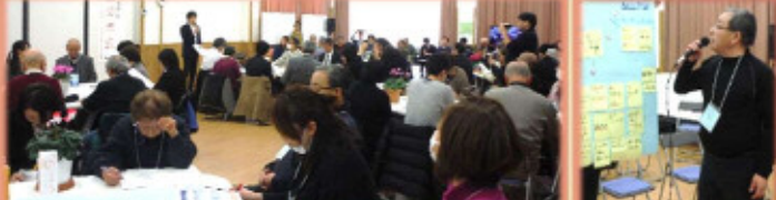
鶴ヶ谷住宅自治会及びお手伝いの皆様、ありがとうございました