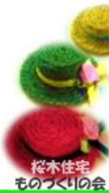
桜木住宅 ものづくりの会