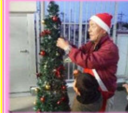
★子供と一緒に点灯式