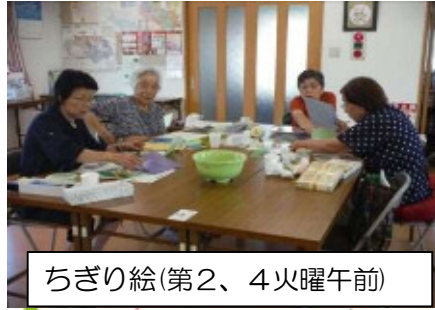
ちぎり絵(第2、4火曜午前)