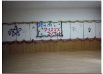
クリスマスコンサート 昼食会の後、ワークショップで楽器を作り、多賀城吹奏楽団アンサンブルの演奏を聴きました。作った楽器で、一緒に演奏したり、音楽に合わせてプレゼント回しゲームも楽しみました。