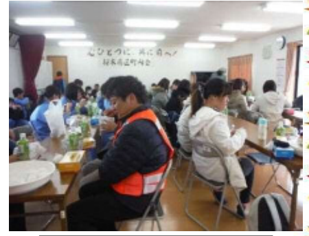
集会所で炊き出し訓練