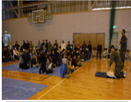
指定避難所の多賀城中学校で AED の訓練