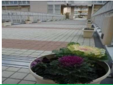
デッキに花を咲かせよう！ 2階デッキ、1階通路には住民が寄せ植えした花々が並び、目を楽しませています。