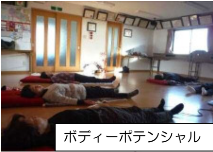
ポディーポテンシャル