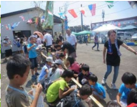
恒例の流しそうめん