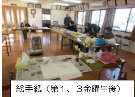
絵手紙 (第1、3金曜午後)