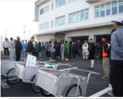
1次避難所の港湾事務所に集合