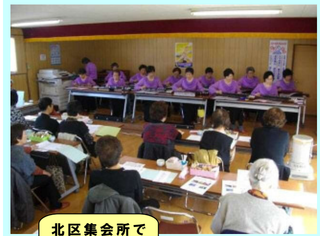
北区集会所で の大正琴演奏