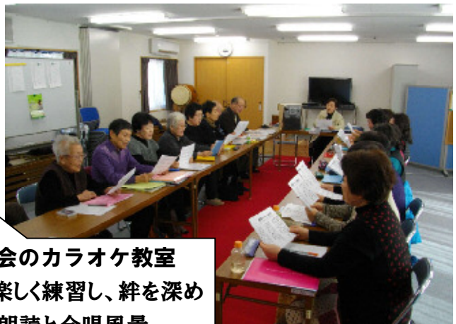
桜木長寿会のカラオケ教室 毎月3回楽しく練習し、絆を深めています。朗読と合唱風景