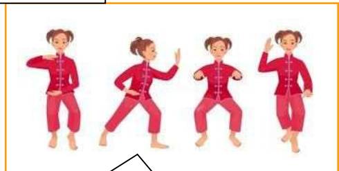
北区では、太極拳教室が開かれました。類似イラスト