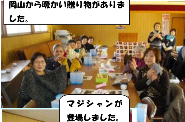
マジシャンが登場しました。