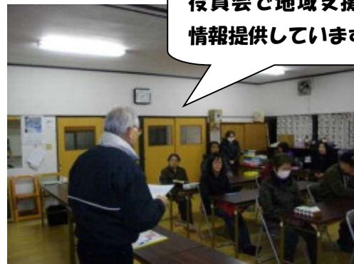
役員会で地域支援員が情報提供しています。