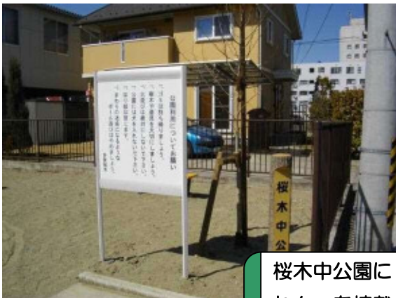
桜木中公園に「もくれん」を植栽、中財公園の滑り台の補修