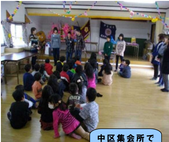
中区集会所で のお別れ会

3月は別れの季節で、各町内会子供会では「歓送迎会」が行われました。北区集会所では、～茶屋さくらぎ～が開催され、大正琴の演奏がありました。カラオケ、手芸、ちぎり絵、太極拳など各種教室も開催されています。