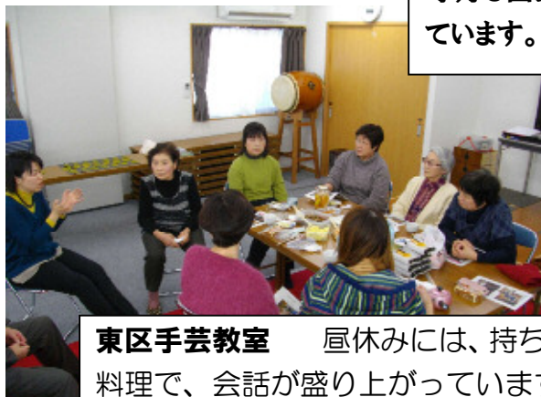
東区手芸教室 昼休みには、持ち寄った料理で、会話が盛り上がっています。