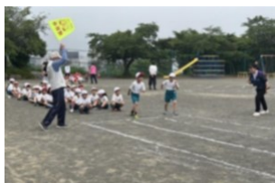
【体力テスト：東小・城南小・東豊中】