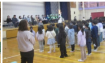
【ボランティア感謝の会：天真小】