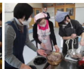
【調理実習支援：城南小】