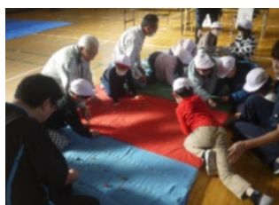
【昔遊び支援：山王小】