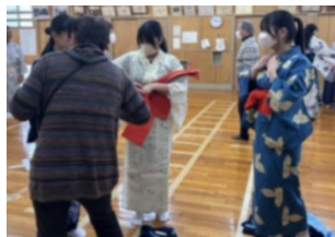
【家庭科着付け体験補助：東豊中】

学校支援活動は、地域のボランティアが学校で児童生徒の学習等を支援し、よりよい教育環境を作っていくことを目的に実施しています。