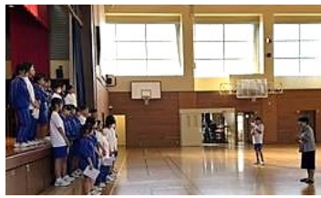
【音楽合唱指導補助・交流学习：多二中】