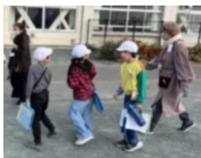
【校外学習見守り：天真小・多小】

先生から「担任一人では、細かい所まで目が行き届かないため、とても助かりました！！」