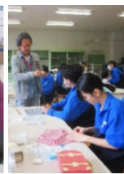
【家庭科ミシン指導補助： 多小 ・ 城南小 ・ 山王小 ・ 天真小 ・ 高崎中】

先生から「担任一人では、細かい所まで目が行き届かないため、とても助かりました！！」