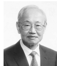
史都・元氣・多賀城 まぢ