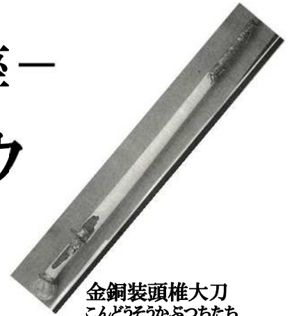
金銅装頭椎大刀 こんどうそうかぶつちたち