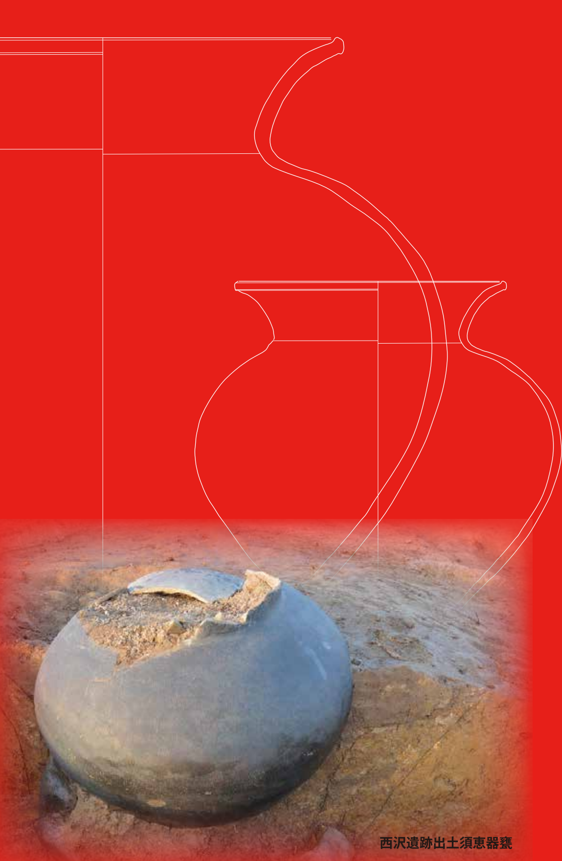
西沢遺跡出土須恵器甕