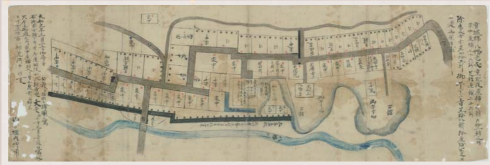
宮城郡八幡邑天童氏屋敷ならびに家中・足軽屋敷絵図

今年で天童市と多賀城市との間で友好都市の締結がなされて20年を迎えます。これを記念し、市指定文化財「天童家文書」を中心に、天童氏が出羽国天童城の城主から仙台藩の重臣となり、準一家としてのどのような役割を担っていたのか。在所として やわた 八幡地区の様子なども交え、その歴史を紹介します。