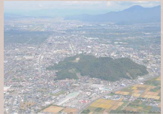
天童古城

しだれざくらきりもんまきえ ふばこ ◀ 枝垂桜桐紋蒔絵文箱 金蒔絵や天童家の家紋である五七桐紋などがあしらわれている豪華な文箱です。江戸時代前期頃の作とされ、準一家という天童家の家格を象徴するような資料です。