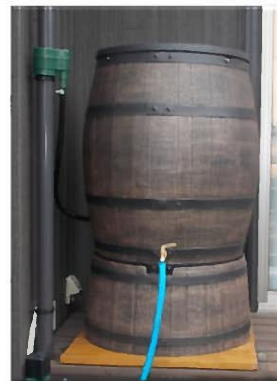
雨水貯留タンク施工例

1家庭でも多くの皆様が本制度を利用いただくことは、豪雨時の市全体の雨水被害の軽減にもつながりますので、ぜひご検討くださいますよう、お願いいたします。