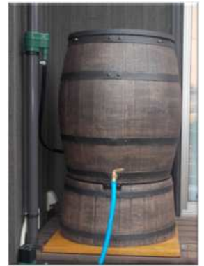
雨水貯留タンク施工例

1家庭でも多くの皆様が本制度を利用いただくことは、豪雨時の市全体の雨水被害の軽減にもつながりますので、ぜひご検討くださいますよう、お願いいたします。