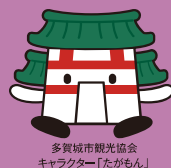
多賀城市観光協会 キャラクター「たがもん」

奈良時代に創建され、陸奥国の国府として栄えてきた多賀城から古代米の一種である黒春米(くしゅうまい)と書かれた木簡が出土しています。 「古代米」には、一般的なお米に比べてミネラルやビタミン、ポリフェノール一種アントシアニンなどの栄養素が含まれています。 「古代米」は、美味しいだけでなく美容や健康にもうれしい食材なのです。