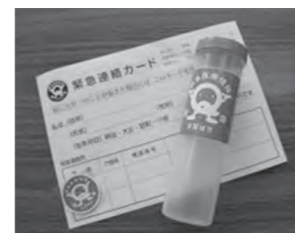
介護福祉課介護予防係 ☎内線 665