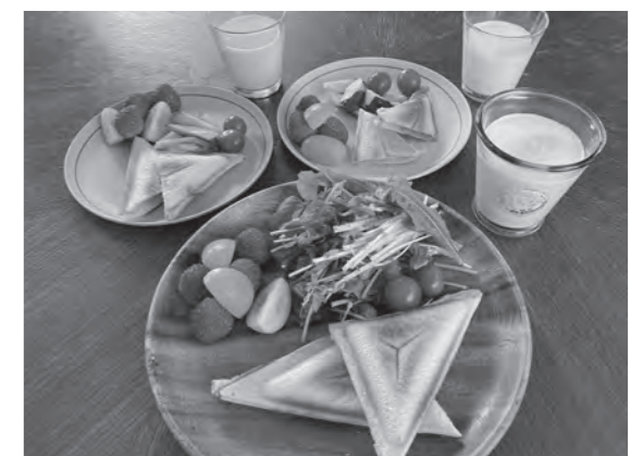
健康課成人保健係 ☎内線 611

かりとした味です。減塩食品を使用しない場合1食約3㍎だった塩分は、ハムとドレッシングを変えただけで約1㍎減らすことができました。減塩は、高血圧などの生活習慣病予防のほか、子どもの味覚を育てるためにも大切です。血圧が気になる人にもお薦めです。子育て中の人にもおすすめです。