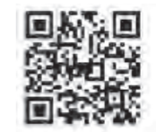
「あした/up」ウェブサイト

多賀城町が多賀城市になったのは昭和46年。今年市制施行50年の節目の年になります。これを記念し、多賀城の魅力を一冊に発信する季刊紙「あした/up」を発行します。50年の歴史を経て、「ここ」に暮らす人たちがいるからこそ、今の多賀城があります。そしてここから「未来の多賀城」へとつながっていくのです。