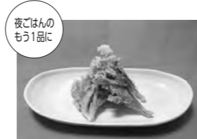
夜ごはんのもう1品に セロリの葉で作った天ぷら