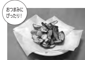
おつまみにぴったり! 里芋の皮で作ったチップス