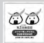
第2段階認証 事業所マーク