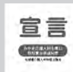
宣言事業所 マーク