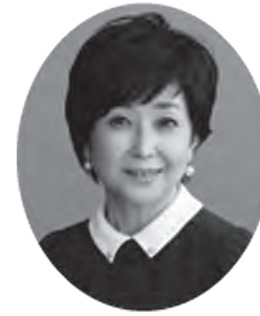
【朗読】 竹下 景子(俳優)

問 東北大学災害科学国際研究所 ☎ 090-7663-4102 地域コミュニティ課広報広聴係 ☎ 内線 254