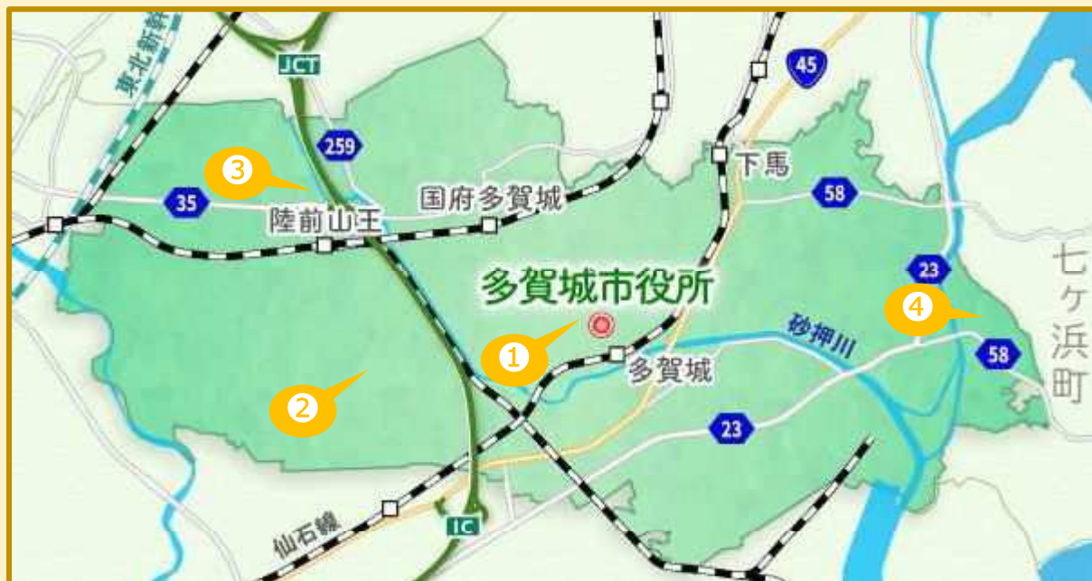
▲EV充電設備公共施設マップ▲