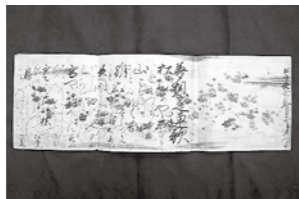
夢想之連歌(太宰府天満宮所蔵)