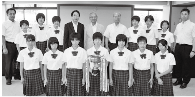
多賀城中学校 女子バレーボール部 第63回宮城県中学校総合体育大会 バレーボール競技