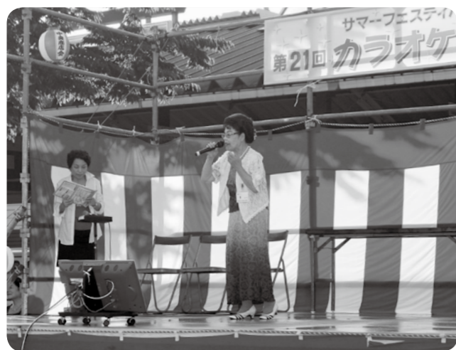
中央商店振興会カラオケ大会(8月1日)