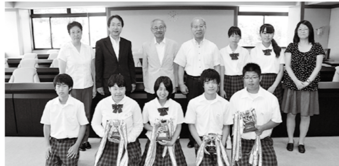
多賀城中学校 男子女子弓道部 第63回宮城県中学校総合体育大会 弓道競技(団体男女、個人男女)