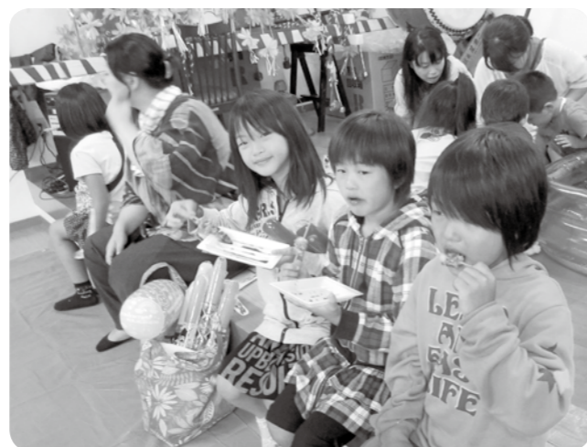
桜木中区夏まつり(8月10日)