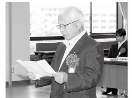
受賞者代表の謝辞