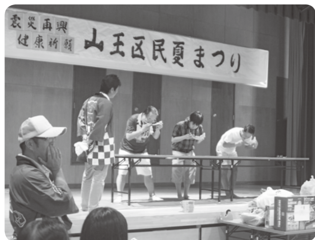
山王区民夏まつり(8月9日)