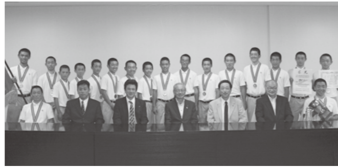
秀光中等教育学校 野球部 第43回若鷲旗争奪東北中学校野球大会