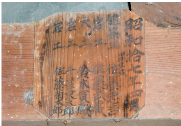
梁に掲げられた棟札

市内で最古とみられる倉は、市川地 区にある板倉で天保6年(1835年) のものでした。そのほか江戸時代に建 築された倉は弘化4年(1847年)、 嘉永3年(1850年)、文久3年(18 63年)のものなどがあり、明治時代で は明治3年(1870年)、明治8年(1 875年)に建築されたものがありまし た。一番新しい倉は昭和23年(1948 年)のものでした。 年代が判明している倉のうち、年号 のほかに大工や石工の名前が記されて いるものが16棟確認されています。な かには大工の居住地が記されているも のもあり、それをみると山王や浮島な どの旧多賀城村内、あるいは旧岩切村 などの近くの村に、倉を建築する技術 を持った大工がいたことがわかります。