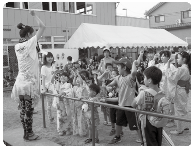
八幡沖区夏祭り(7月26日)