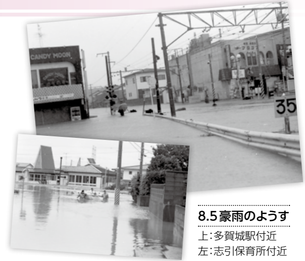
8.5豪雨のようす 上:多賀城駅付近 左:志引保育所付近

9月1日は、関東大震災が発生した日であること、またこの時期は台風が多く発生し、災害への心構えが必要ことから「防災の日」に制定されています。 いつ発生するかわからない災害に対し、私たちにできることは、日ごろから災害を意識した備えをすることです。