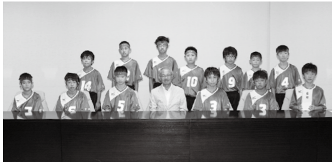
TRY-PAC 第24回全日本ドッジボール選手権 宮城県大会