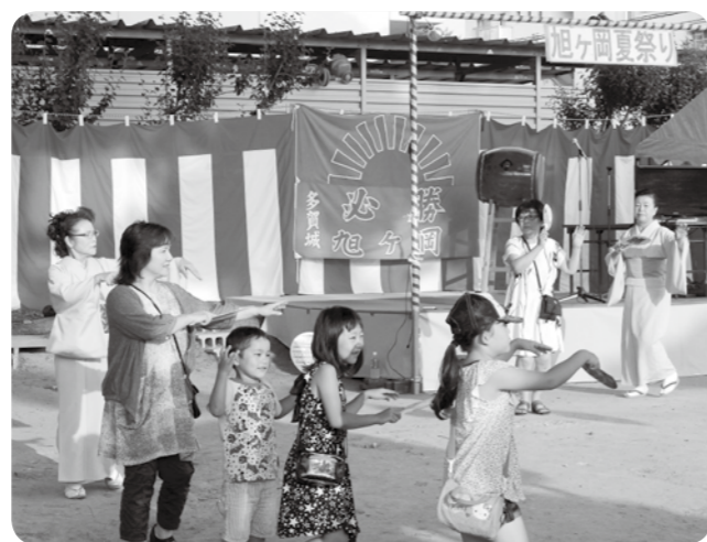
旭ヶ岡夏祭り(7月26日)