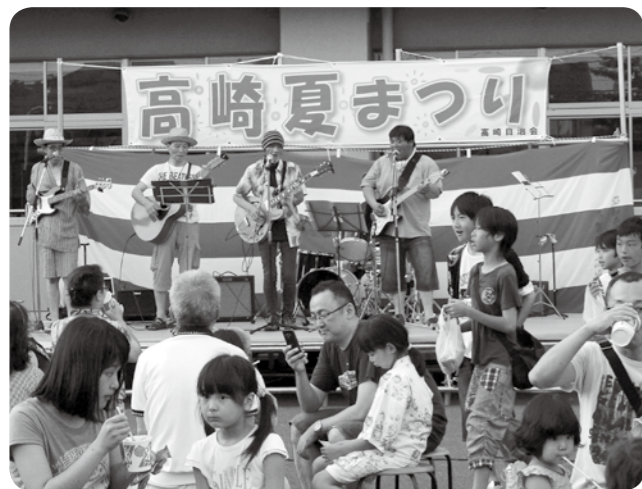
高崎夏まつり(7月26日)