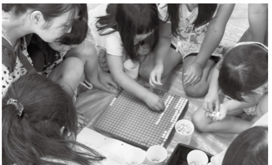
モニュメント製作の様子

東日本大震災で被災した桜木保育所の再建にあたり、モニュメント「みんなの壁」の第2回ワークショップが7月26日に開催されました。