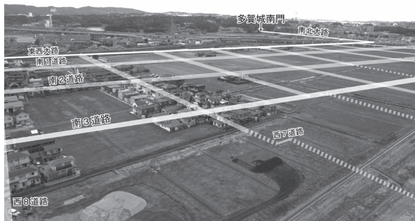
▲古代のまち並みの南西側から多賀城跡を望む（白線は道路網の推定位置）

調査で明らかになった古代のまち並みの南限付近になります。これまで、東西大路より南側には、2本の東西道路が確認されてきました。今回の調査では、新たに3本目の東西道路を発見しました。この「南3道路」は、東西大路とほぼ平行し、路面の幅はおよそ2〜3mで、南北両側に排水用の側溝が付いています。南3道路の発見により、東西大路よりも南側に3ブロック分まで、四方を道路で囲まれた「街区」が広がっていたことが明らかになりました。また、南3道路よりも南側の様子も確認することができました。街区内は、建物や井戸が多つくられた空間でした。建物や井戸の方向は、ほぼ道路と同じ向きに統一されており、規則的に配置されていたと見られます。一方、街区外には建物や井戸はあまり見られず、畑作に