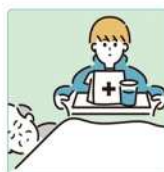
がん・難病・精神疾患など慢性的な病気の家族の看病をしている。