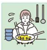
障害や病気のある家族に代わり、買い物・料理・掃除・洗濯などの家事をしている。

子ども・若者育成支援推進法は、「家族の介護その他の日常生活上の世話を過度に行っている」と認められる子ども・若者」として、ヤングケアラーを、国・地方公共団体等が各種支援に努めるべき対象としています。