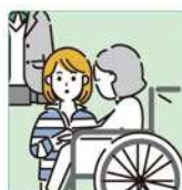
障害や病気のあるきょうだいの世話や見守りをしている。