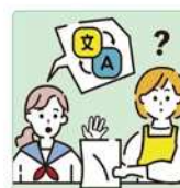
日本語が第一言語でない家族や障害のある家族のために通訳をしている。