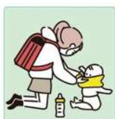
家族に代わり、幼いきょうだいの世話をしている。