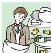
アルコール・薬物・ギャンブル問題を抱える家族に対応している。