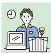
家計を支えるために労働をして、障害や病気のある家族を助けている。