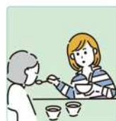
障害や病気のある家族の身の回りの世話をしている。