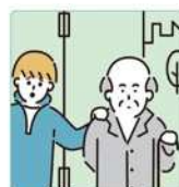
目を離せない家族の見守りや声かけなどの気づかいをしている。