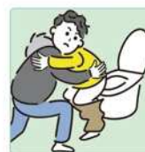
障害や病気のある家族の入浴やトイレの介助をしている。