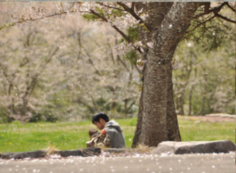
多賀城跡あやめ園