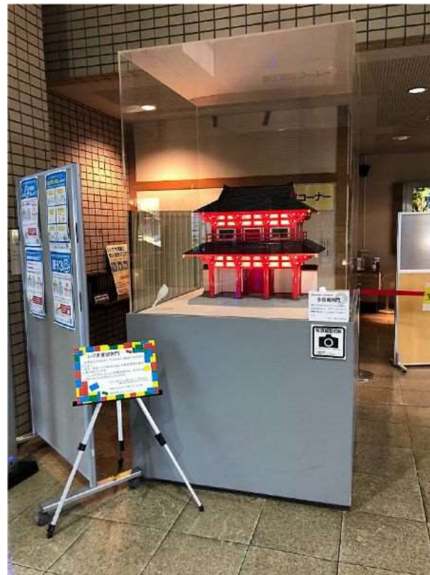
多賀城市役所ロビー