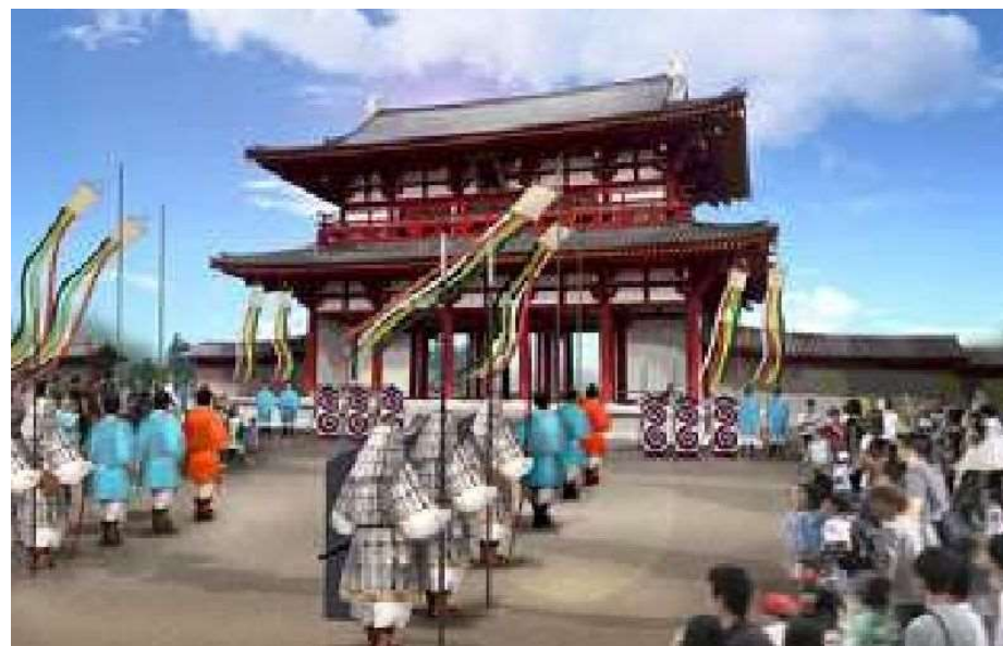
儀式の再現イメージ