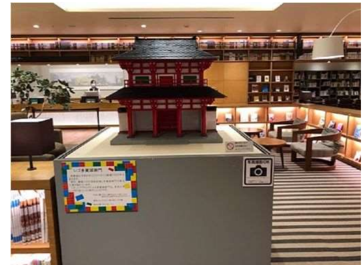
多賀城市立図書館1階