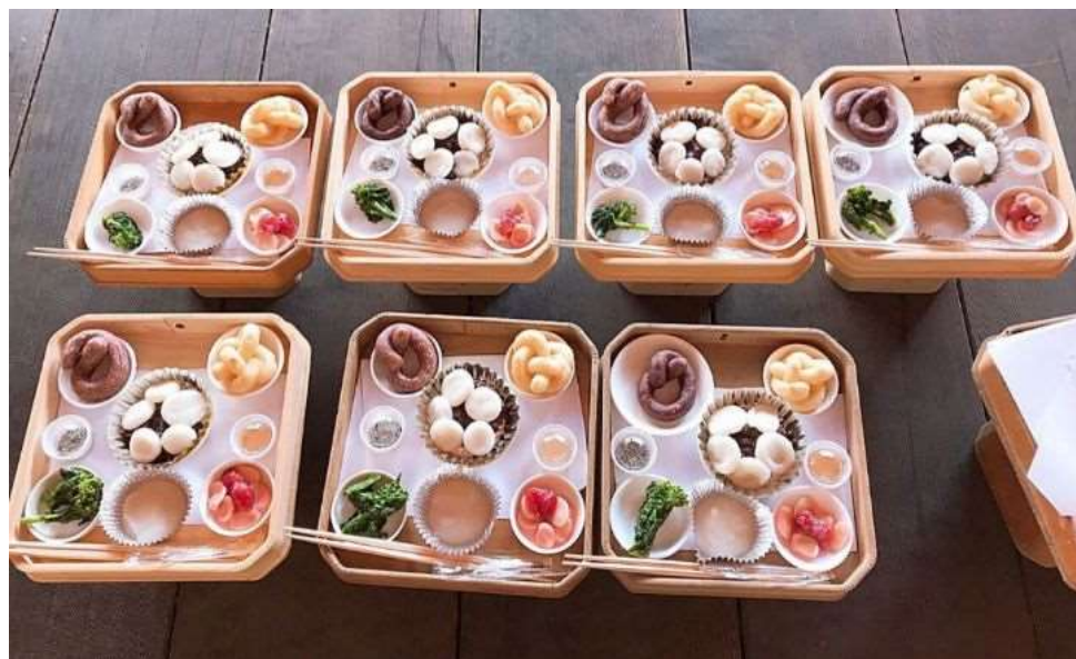
古代スイーツの再現イメージ