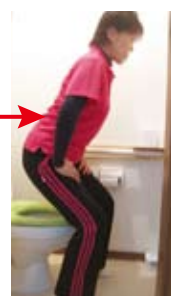
トイレから出る前に立ち座り(スクワット)