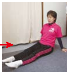
足首の曲げ伸ばし