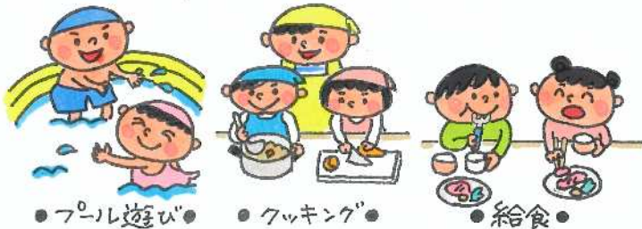
● プール遊び ● クッキング ● 給食 ●