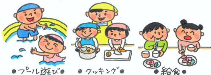
● プール遊び ● ● クッキング ● ● 給食 ●

ここは私たち年長さんのクラス。なにか話し合っているね。グループの名前を決めているんだって! 小学校に行くことを楽しみにしながら、話を聞いたり、自分の意見を言ったりする経験をいくんだよ!