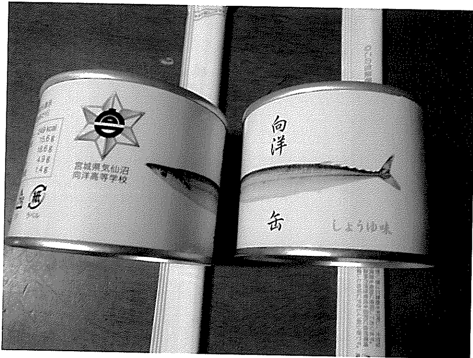
気仙沼|向洋高校生製造の缶詰 向洋缶