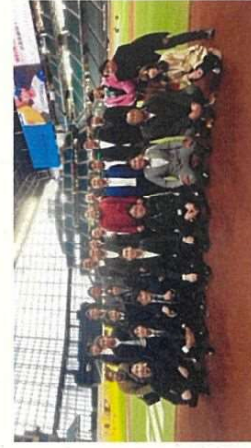
◆全国若手議員の会でエスコンフィールドの視察

多賀城市が掲げる将来都市像「日々のよここびふくらむ、まち 多賀城」の実現のため、残り1年半の任期で、これまでに以上に活動していきましますので、引き続きよろしく願い申し上げます。