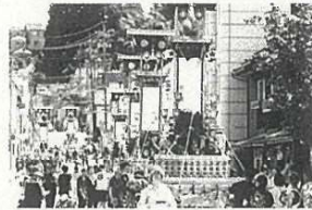
日本の祭りシリーズ 石川県能登町・あばれ祭 (令和6年7月5、6日開催)