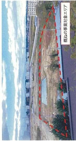
◆スポーツウェルネス施設予定地(令和7年10月時点)