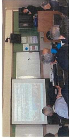
◆市議会活動報告会の様子(令和7年4月)

なお、これまで年1回市議会活動報告会を実施してまいりましたが、今後は、複数地区での座談会形式での報告会実施を検討しております。ご参加を希望される際には、以下公式LINEでご案内しますのでご登録をお願いします。