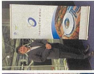
◆放射光施設(NanoTerasu) (ナノテラス)の視察(仙台市)