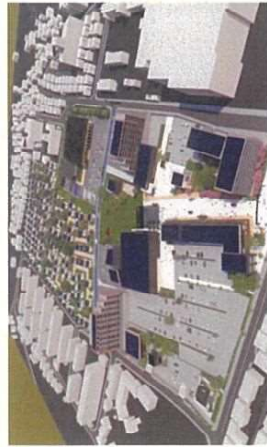
◆キャンパス跡地開発イメージ(ミサワホーム(株)が多賀城市に提供) 出典:多賀城市スポーツウェルネス施設整備基本構想

なお、キャンパス跡地全体(11.5ha)はミサワホーム株式会社が取得し、南側に商業施設やマンション、北側に戸建て住宅を整備予定です。詳細の開発計画は未だ公表されていませんが、市中心部の大規模開発で、周辺道路整備や小中学校児童生徒人数等、市のまちづくり全般に大きな影響を及ぼすことから私も引き続き状況を注視してまいります。