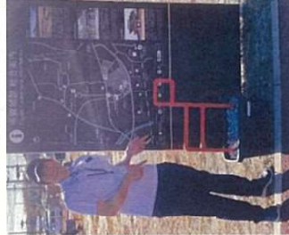
◆みやぎオラル多賀城コース オープンングイベント

なお、これまで年1回市議会活動報告会を実施してまいりましたが、今後は、複数地区での座談会形式での報告会実施を検討しております。ご参加を希望される際には、以下公式LINEでご案内しますのでご登録をお願いします。