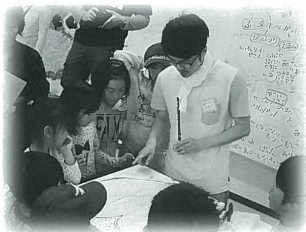
「みんなの壁」製作ワークショップ

答 2・3メートル四方程度の大きさで、桜木公営住宅2号棟の2階にできる桜木保育所の入口付近に設置する予定です。