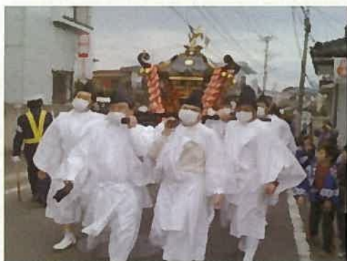
震災復興の担い手としての保存会メンバー