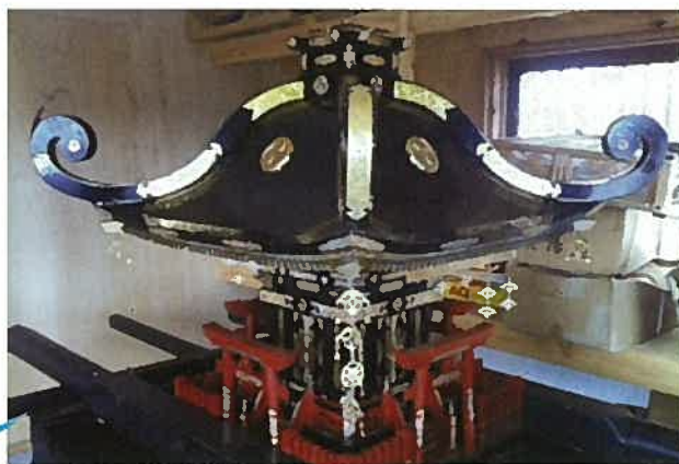
(修繕前:津波で装飾品が壊れたお神輿)