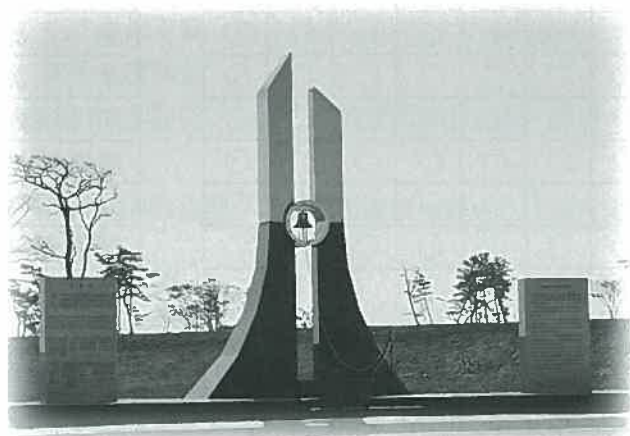
震災慰霊碑（岩沼市）

答 モニュメントのコンセプトは、犠牲者の追悼、震災の記録・伝承、減災への誓いの三つであります。このような観点から、人が集まり、震災を後世に伝えていく場所として適していること、また駅前という利便性を考慮して、決定しました。