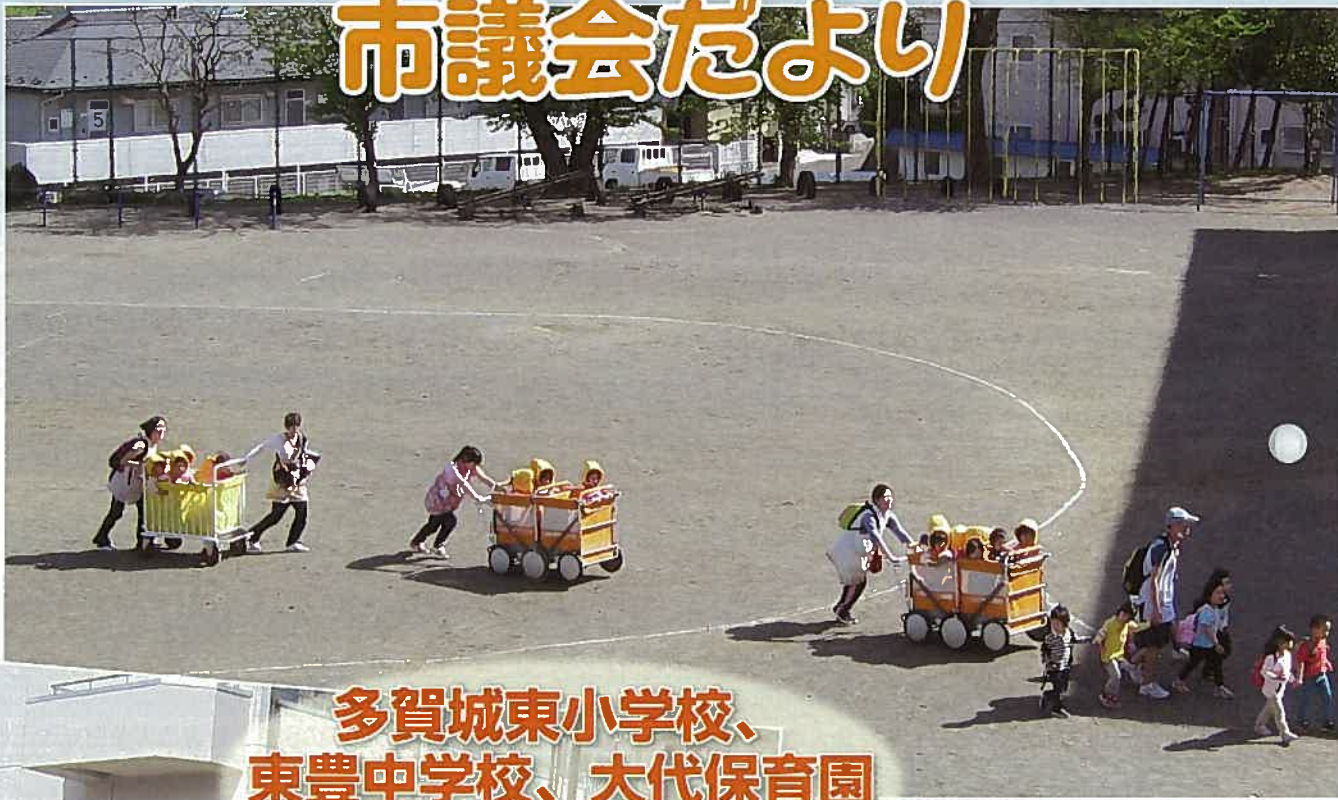
多賀城東小学校、 東豊中学校、大代保育園 合同の引渡訓練