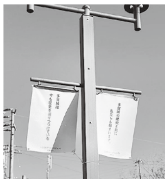
▲多賀城駅前に掲出していることばの アートプロジェクト