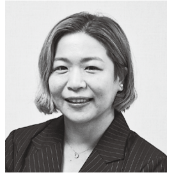
日本共産党 峪 道子 議員