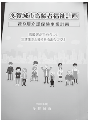
▶ 多賀城市高齢者福祉計画 第9期介護保険事業計画

答3 今後アンケート結果の分析を行うと共に、有識者や市民を含む関係者等の意見を反映し本市の実態に即した計画を策定する。