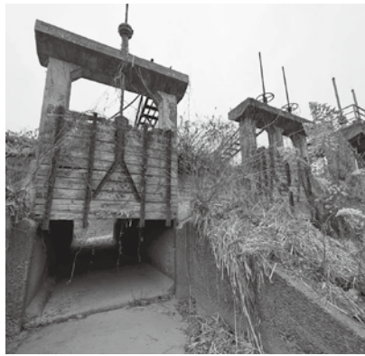
▲原谷地川の既設樋門

維持管理については、受益者負担が望ましいと考えている。現在も協議を行っており、お互いのまちの安全確保のために引き続き協議を進める。