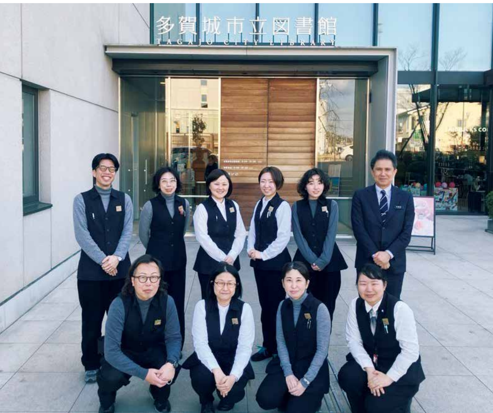
▲多賀城市立図書館の指定管理者の皆さん