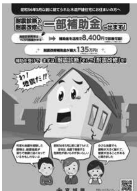
▶宮城県の一部補助金のお知らせ

答3 ①本市では、耐震診断及び耐震改修に係る費用の一部を助成する耐震改修促進事業を実施してきたが、県に合わせ、対象範囲を広げていきたい。②全国の自治体で実施している実績があり、現在実践事例を参考にしながら制度設計に着手している。耐震改修促進事業の拡大と共に令和8年度から取り組む予定としている。