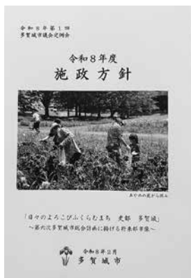
▶ 令和8年度施政方針

者の避難支援の可能性を高めることとができるよう、地域の皆さんと共に取り組んでいく。② 令和8年度は、アンケート調査結果を基に計画素案の取りまとめ、議員への説明、パブリックコメントの実施、子ども・子育て会議での諮問・答申を経て、令和8年度内に計画を策定・公表し、令和9年4月の施行を目標として準備を進めていく。