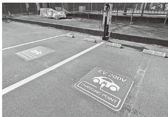
▲市役所西側駐車場EV充電設備

答 電気自動車9台、水素自動車0台である。 質 広報方法は。 答 広報誌やホームページ、SNS、デジタルサイネージなど市が有するツールを活用し、周知を行った。また、市内の自動車販売店に、チラシ配布等の案内を行った。