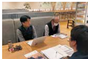
▲インタビューの様子