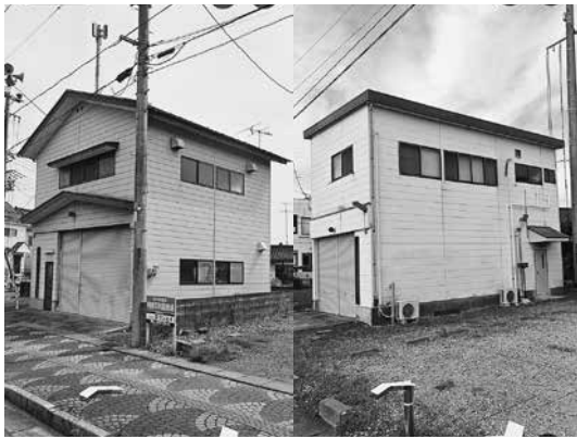
▶ 第6分団ポンプ場（左）と第5分団ポンプ場（Google Mapから）

交通渋滞が発生することによって命を危険にさらすリスクをさらに高めてしまう要因になるものと承知している。渋滞緩和に向けた取り組みについては、本市だけでは対応しきれない部分もあるため、引き続き県や国などと連携しながら対応に努める。