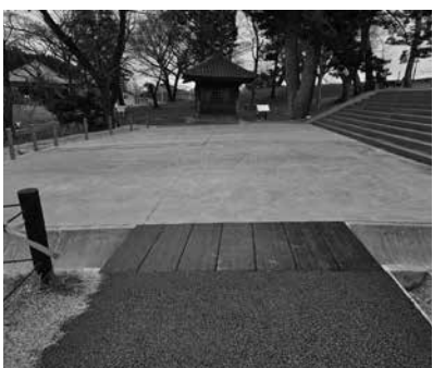
▲側溝を渡るために設置してある擬木製側溝蓋