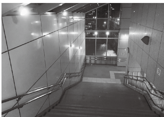
▲臨時の照明を設置している悠久ロマン回廊

答 工事事業者決定後の調整となるが、歩行者の安全に配慮した上で工事期間も通行可能としたい。