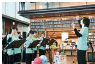
▲図書館10周年記念イベント