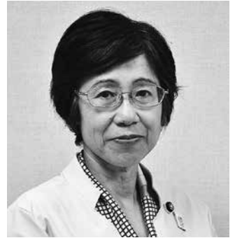
日本共産党 伊藤 真弓 議員