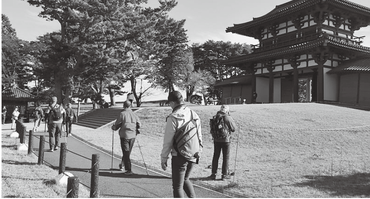
▲多賀城南門とオルレの様子

北端部整備の状況は、着手出来ない状況にある。事業を進めるには多額の費用、維持管理、住民生活との調和などさまざまな面で整理する必要がある。実施するには相応の時間を要する。 質 活用上の課題は、全国的にも整備、活用が進んでいる史跡である。見学者も増加しているが、この賑わいが一過性のものとならず継続していくよう県も含めた関係機関と連携を図り、地域資源として活用する手段及び施策の構築が重要と考えている。