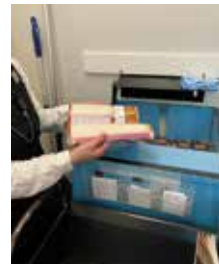
▲返却口の本を確認する様子