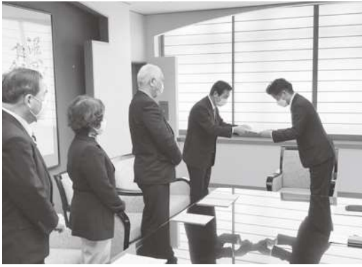
深谷市長へ提言書を提出