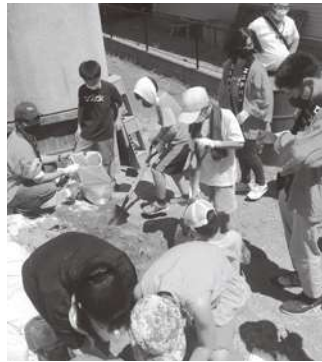
令和3年8月6日 大代地区公民館防災キャンプで土のうづくり