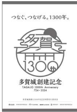
多賀城創建1300年記念ポスター

① 切手の発行や2024年用の年賀はがきの取り組みについては、多賀城創建1300年をPRする良い方策であると考えますので、検討を進めてまいります。観光大使につきましては、表敬訪問いただいた著名な方に「日々のよろこびふくらむまち 史都 多