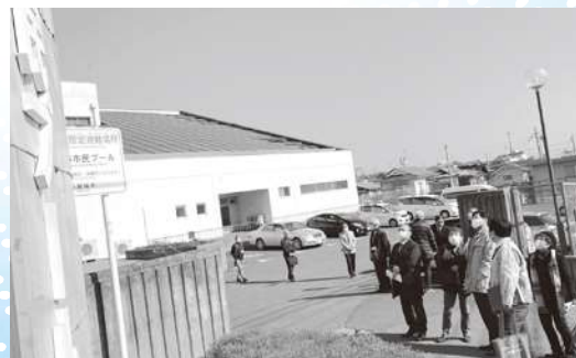
市民プールでの調査状況

多賀城市総合体育館及び多賀城市市民プールの維持管理のための提言書を市長・教育長に提出 — 文教厚生常任委員会が現況調査 —