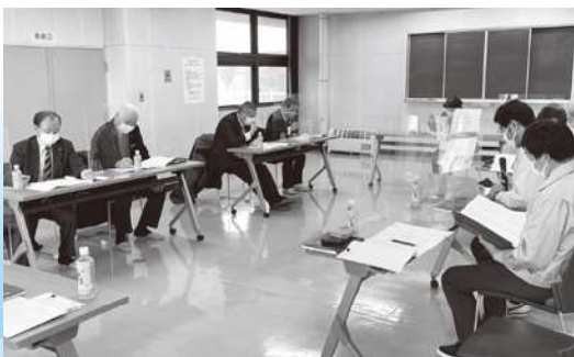
総合体育館での調査状況