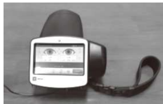
屈折検査機器フォトスクリーナー

検査手技や暗所の環境設定など、検査場所の検討が必要なほか、検査で所見があった幼児への対応として、眼科医との連携も検討する必要があります。先進地域の取り組みを確認しつつ、今後調査研究を行ってまいります。