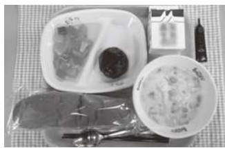
米粉パンによる給食