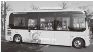
多賀城市コミュニティバス

①現下のデジタル社会の進展状況に鑑みてICT活用促進を喫緊の課題と捉えましたので、無料パスなどの発行はしないこととしました。②バス運賃の無料化がもたらす影響を検証するとともに、スマートフォンなどを活用したデジタル社会のもたらす恩恵を享受し、社会参加や生きがいづくりを通して豊かな生活を送っていただくための、ICT活用