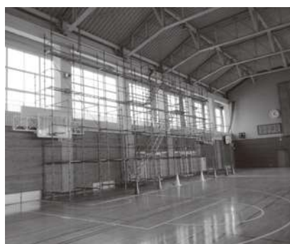
第二中学校体育館

答 本市は、全国市有物件災害共済会の保険に加入しており、地震被害については、地震災害見舞金の対象になるため、現在、手続きを進めております。