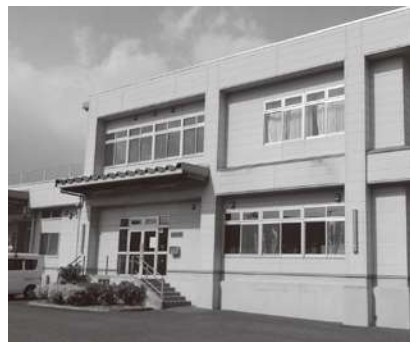
学校給食センター

答 自治体単位の取り組みではなく、国策としての対応が望まれます。物価高騰による市民生活への影響に関して、その実情をしっかりと伝え、適切な対応がなされるよう、国に要望してまいります。