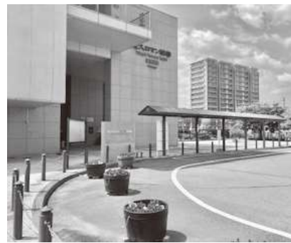
JR東北本線 国府多賀城駅

じないよう管理体制について検討してまいりたいと思います。また、創建1300年に向け、イベント開催などの活用もしていけるように、整備を進めてまいりたいと思います。