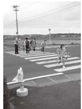
要聖交差点を下校中の児童の皆さん

答 信号機設置については、通学路の安全確保のため、以前から塩釜警察署を通じて信号機の設置を判断する宮城県公安委員会に状況をお伝えし、要望をしておりますが、信号機の必要性がさらに高まると認識しておりますので、引き続き強くお願いしてまいります。標識設置については、塩釜警察署にお伝えしており、標識の設置者である宮城県公安委員会と対応について協議、検討し、標識の設置位置、制限速度などの最適化に取り組みと伺っております。