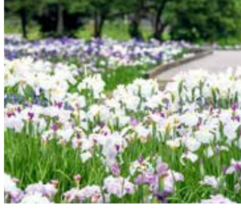
毎年あやめの開花する6月中旬から6月下旬まで多賀城跡あやめまつりが開催されます。

多賀城跡の一角にあり、あやめ・花菖蒲など800種、300万本が咲き乱れ、市民や観光客の目を楽しませます。シーズンには、「多賀城跡あやめまつり」が開催されます。