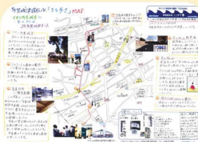
多賀城高校による津波伝承 「まち歩き」MAP