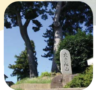
過去の災害の教訓も 多賀城の「歌枕」