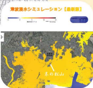
東日本大震災を超える 津波浸水想定