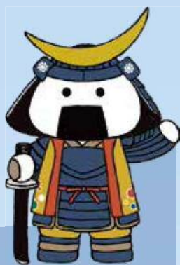
仙台・宮城観光PRキャラクター むすび丸