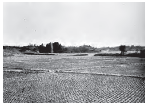
多賀城南辺築地跡 かつては土塁と考えられていました(発掘調査開始前の風景)

政庁地区は当時、内城と呼ばれ、古くから建物の礎石が露出し、その周囲には約100メートル四方に巡る土塁状の高まりの存在が知られていました。発掘調査により、奈良時代から平安時代に及ぶ多数の建物跡の存在が確認され、それらを時期別に整理すると、各時期ともほぼ同様の建物配置によっていたことが分かりました。すなわち中心となる正殿が中央のやや北側に位置し、その前方には広場を挟んで東西の脇殿が向き合い、南辺築地の中央には南門が開くというように、左右対称の建物配置となっています。また、土塁状の高まりは築地塀であることが判明し、築地塀で囲まれた内城の在り方は、大宰府の都府楼や近江国府の政庁と基本的に同じであり、地方官衙(役所)の中枢部の構造に極めて類似することが明らかになっていきました。多賀城については、当初蝦夷に対する軍事的な前線基地として設置されたものが、蝦夷征討が進むに従って拡大整備され、鎮守府が置かれて、やがては陸奥国府も併せ置かれるようになったと考えられていましたが、発掘調査の結果から導き出された見解は、このよう