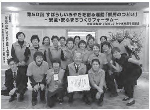
問／介護福祉課介護予防係 内線 6655、6666

地域で行っている介護予防活動が「安全で安心なまちを創る運動」および「心の通い合う地域を創る運動」として認められ、11月15日(火)に宮城県が主催する「県民のつどい」安全・安心まちづくりフォーラムにおいて、表彰式が行われました。