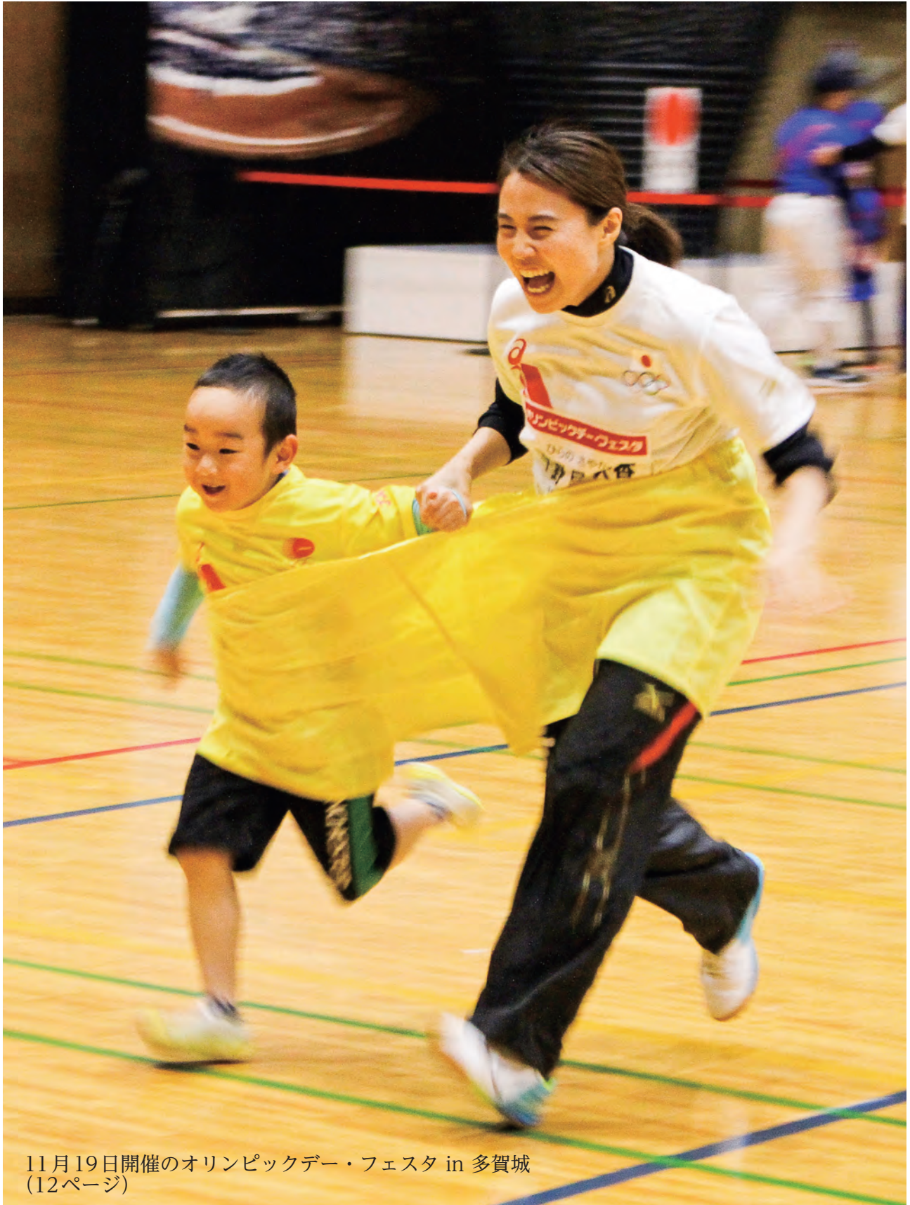
11月19日開催のオリンピックデー・フェスタ in 多賀城 (12ページ)