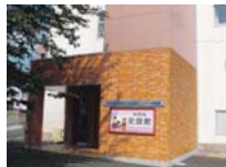
火おしなど無料で挑戦できる体験メニューもある

●たがしやうしゅうかん (たがしやうまいやうふんかざい ちやうせんたーたいけんかん) ☎022-368-3127 (MAP) P22D2 縄文時代から江戸時代までの多賀城市の歴史を学べる施設。縄文カゴづくり200円や、まが玉づくり150円〜などの体験ができる(10人以上は要予約、料金や所要時間は内容により異なる)。 ●多賀城市中央2-25-5 ④JR多賀城駅から徒歩10分 ⑤入館無料 ⑥時〜1時30分(体験受付は〜15時45分) ⑦月曜(祝日の場合は閉館)、祝日の翌日(土・日曜の場合は閉館) ⑧11台