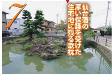
末の松山から南へ100mほど歩いた住宅地にある

●おきのい ☎022-364-5901 (史跡多賀城観光案内所) (MAP) P22D3 直径約20mの奇石が運る池「わが袖はしほにみえぬ おきの石の 人こそしらね かわくまぞなき」(千載和歌集、二条院御歌)などに詠まれる歌枕として、江戸時代には仙台藩が守人を選定大切に保護した。 ●多賀城市八幡 ④JR多賀城駅から徒歩8分 ⑤見学自由 ⑥8台