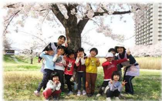
保育所周辺には自然がいっぱい ～ 散歩 ～