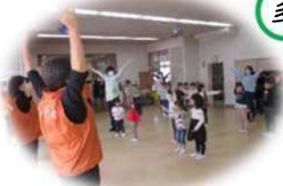
地域の方とのふれあい