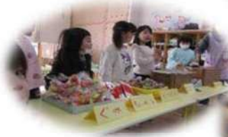
お店屋さん ごっこ