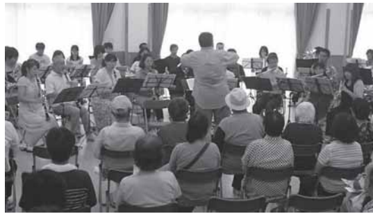
多賀城吹奏楽団が鶴ヶ谷地区災害公営住宅集会所で絆コンサートを開催

一問 被災された方々が災害公営住宅に移り、新しい生活をスタートしています。過去の大規模災害であります阪神・淡路大震災を教訓とし、コミュニティづくりと見守り支援が大事な課題です。①コミュニティづくりと見守り支援の現状について②鶴ヶ谷地区災害公営住宅のコミュニティ支援については③社協復興支えあいセンターは何年度まで設置しますか。 答 ①桜木住宅と新田住宅には入居者自治体が組織されており、住宅内の環境整備はもとより、夏祭り等の交流イベントが実施されるなど積極的に自治活動に取り組みられています。見守り支援については、高齢者生活相談所及び社協復興支えあいセンターが訪問や電話連絡を定期的の実施しています。②鶴ヶ谷住宅では、合計10回の交流会を開催しています。11月頃の自治会設立を目指し話し合いが行われています。③災害公営住宅の自治会が主体的に事業を展開でき