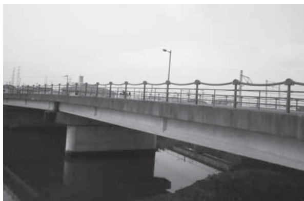
工事完了済みの舟橋

答 樋の口大橋、舟橋、鎮守橋、笠神新橋、鴻の池橋の5箇所は、すでに補強工事が完了しています。