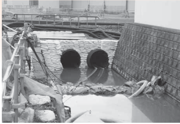
高橋雨水幹線 JR横断部分の工事状況