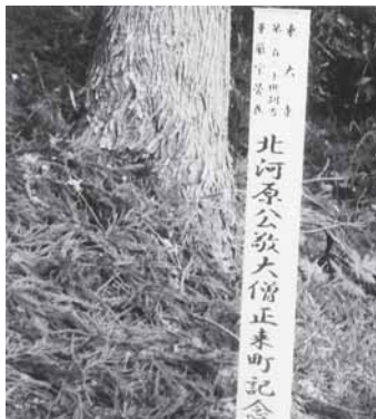
涌谷町の黄金山神社境内周辺に設置されている記念の標柱

多くの御支援については、多賀城市震災経験・記録伝承事業「たがじょう・見聞憶」などで後世へ伝えられるよう広く公開していくほか、今後、平成30年4月に開催予定の東大寺展やそのプレイベントなどで、広く皆様にお知らせしたいと考えております。