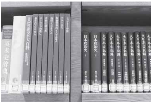
新図書館では世界史と日本史が同じ番号、同じ棚になっています。

答 実効性のある様々な治水対策を講じ、官民協働で水害に強い快適なまちづくりを推進するため、多賀城市総合治水計画を平成27年5月に策定しました。