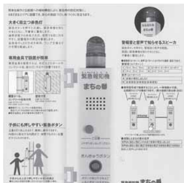
緊急報知機「まちの番」

答 ①市民の安心安全の確保とその対策の重要性は十分に認識しています。②県交付金を活用しながら、防犯街路灯のLED化を推進します。③装置の設置は考えていませんが、今後とも地域や学校等の関係団体と連携しながら防犯対策に取り組みます。