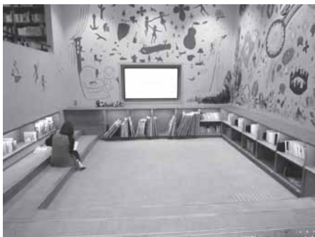
市立図書館の読み聞かせコーナー

解願います。②創意工夫により、利用しやすく選びやすい環境づくりに努めてまいります。③児童書のコーナーで比較的高い位置にあるのは高学年対象の図書ですが、取りづら場合はスタッフに声掛けをお願いします。